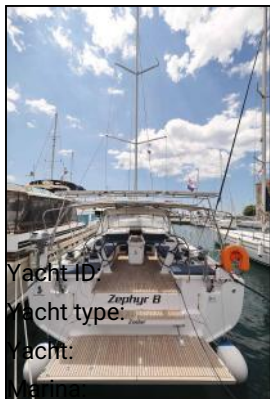
Yacht ID: Yacht type: Yacht: