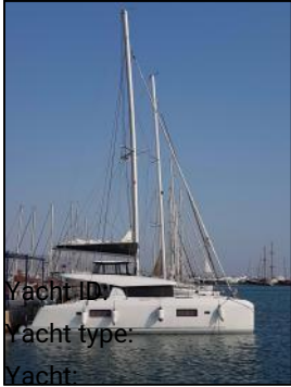
Yacht ID: Yacht type: Yacht: