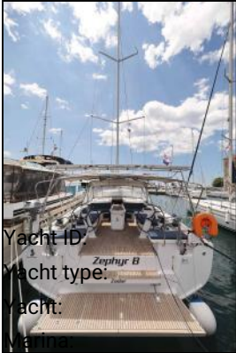
Yacht ID: Yacht type: Yacht: