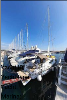
Yacht ID: Yacht type: Yacht: Marina: