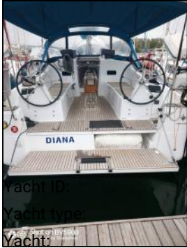
Yacht ID Yacht type Yacht:

Marina: Production year: Cabins: Deposit: