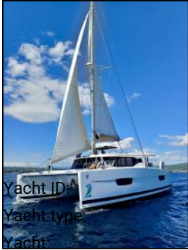
Yacht ID: Yacht type Yacht: